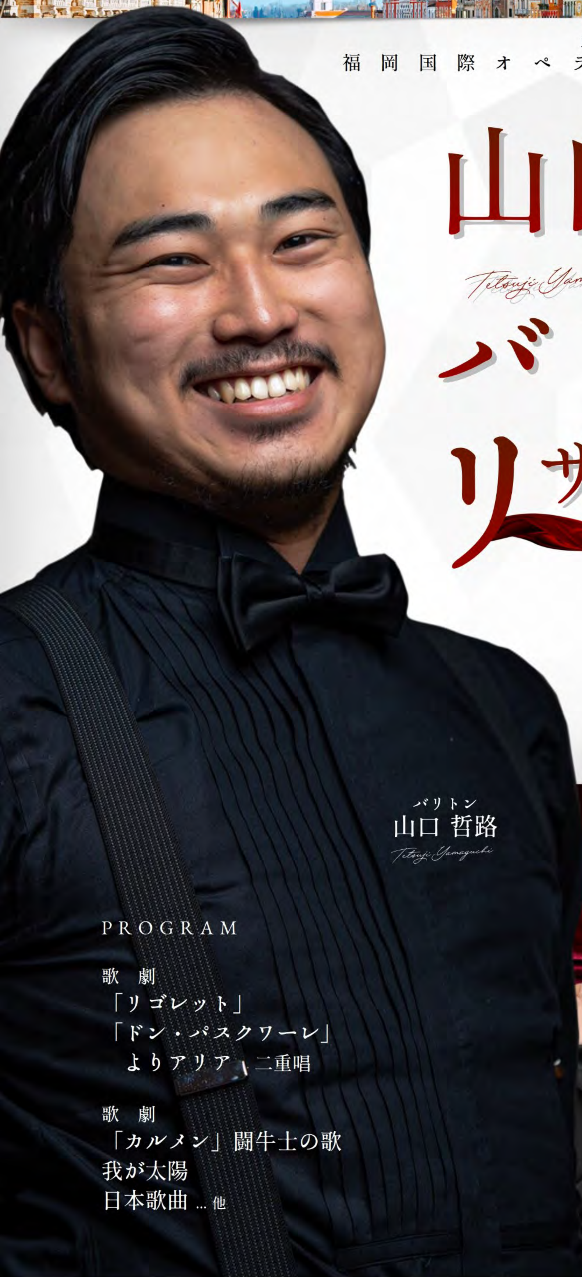
バリトン 山口 哲路 Tetsuji Yamaguchi