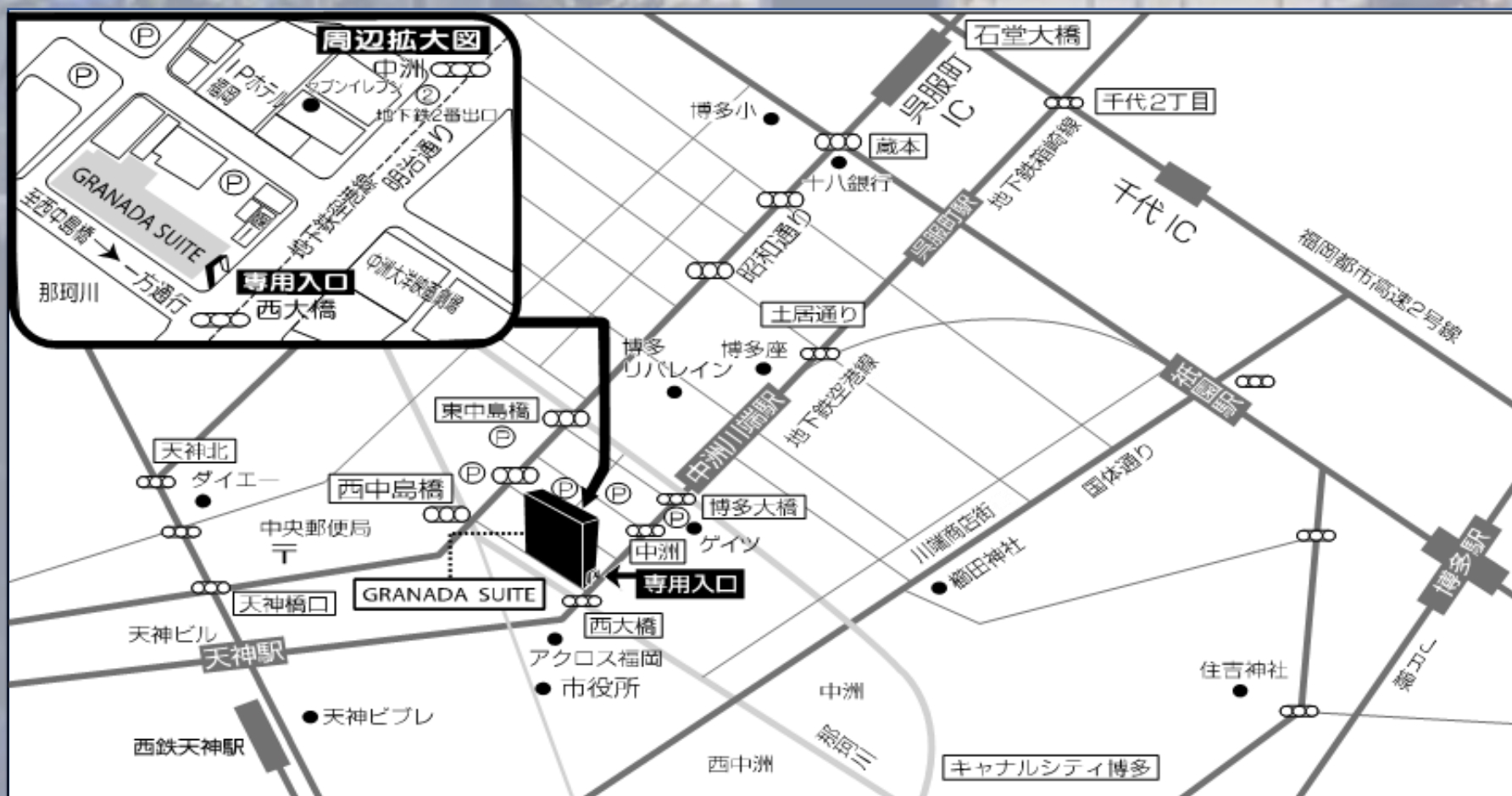
会場へのアクセス

club O/Dでのレギュラーイベントをはじめ、国内外の数々のアーティストのサポートDJを務めてきた。フロアとの対話の中でgroovyな空間を創り出す。